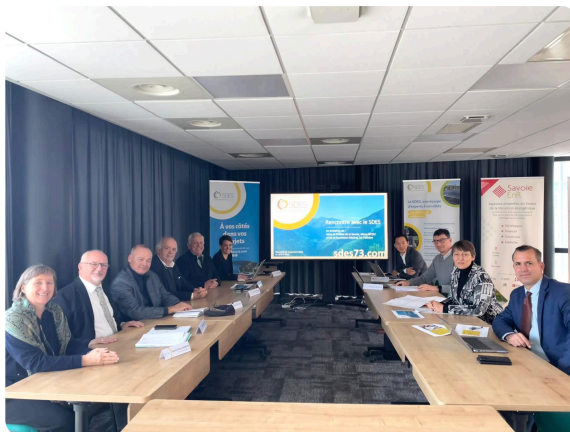
Visite de Mme la Préfète et M le Secrétaire Général - 12 novembre