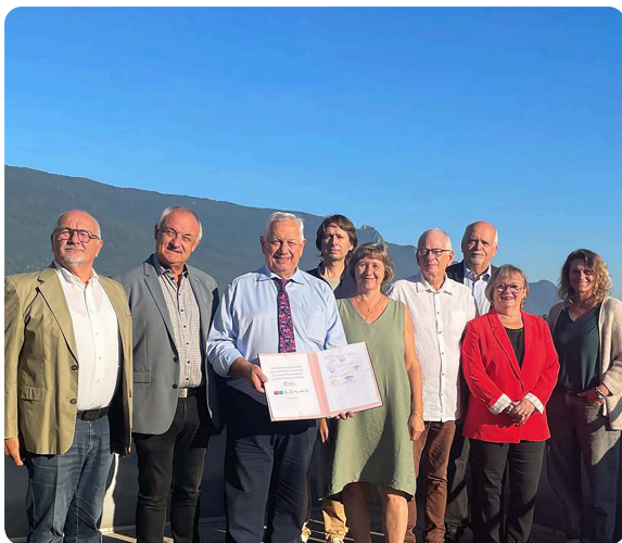
Signature de la convention de partenariat pour le CCR Territoires de Savoie - 19 septembre