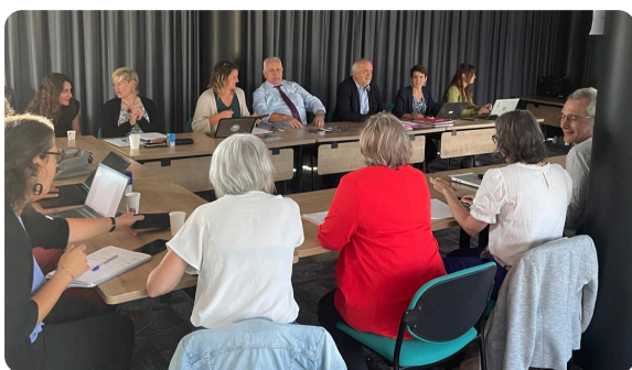
Premier COPIL du CCR Territoires de Savoie - 19 septembre