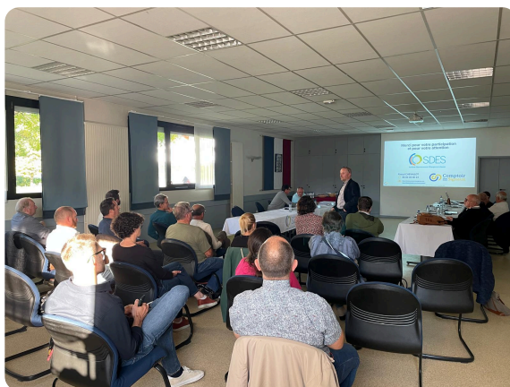
Session d'acculturation à l'IA - 30 septembre

La rentrée au SDES a été marquée, en septembre par la signature de la convention de partenariat avec les 7 intercommunalités partenaires dans le cadre du Contrat de Chaleur Renouvelable (CCR) de l'ADEME . En fin de mois, les élus et agents du SDES ont pu assister aux côtés des communes savoyardes volontaires à une session d'acculturation à l'intelligence artificielle proposée par notre partenaire Le Comptoir des Signaux .