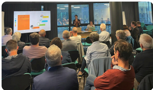
Élections des délégués en collège, au SDES