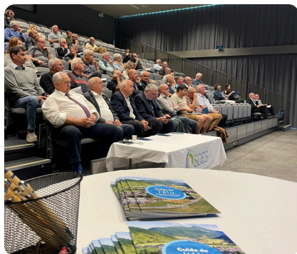
Premier comité syndical d'installation - 20 mai