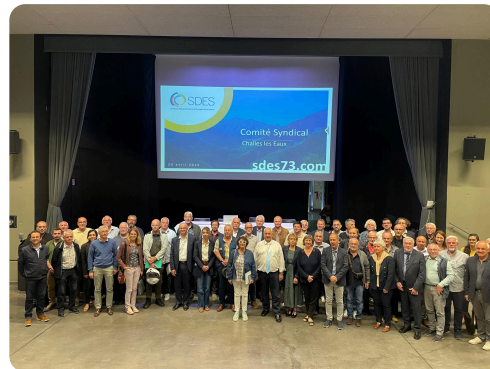
La nouvelle équipe d'élu du SDES

Un nouveau mandat commence en ce printemps 2026, avec une nouvelle équipe prête à poursuivre la politique du SDES et à vous rencontrer très prochainement sur le terrain.