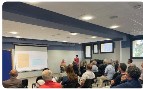
Élection des délégués en collège, Montmélian